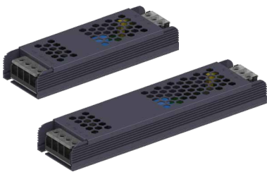
LB048 арт.41957/41958 (100/200W)

Трансформатор электронный (драйвер) LxWxH, mm (120/150x50x20)