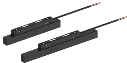
LB48 арт.41955/41956 (100/200W)

Трансформатор электронный (драйвер) LxWxH, mm (120/150x50x20)